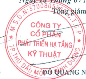
Đ. QUANG NGÔN