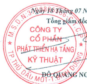
ĐỖ QUANG NGÔN